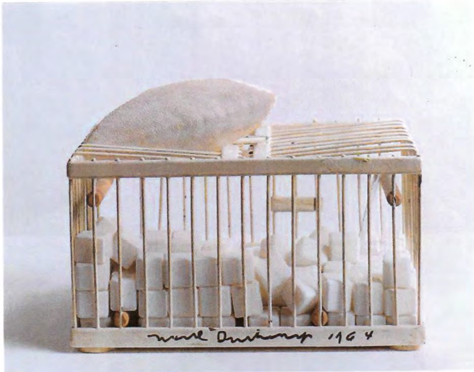
Vue n° 1

Marcel DUCHAMP, Why Not Sneeze Rose Sélavy ? (Pourquoi ne pas éternuer Rose Sélavy ?), 1921, réplique de 1964, « ready-made assisté », 152 cubes de marbre en forme de sucres avec thermomètre et os de seiche dans une cage à oiseaux en métal peint, 12,4 x 22,2 x 16,2 cm. Collection Arturo Schwarz, Milan.