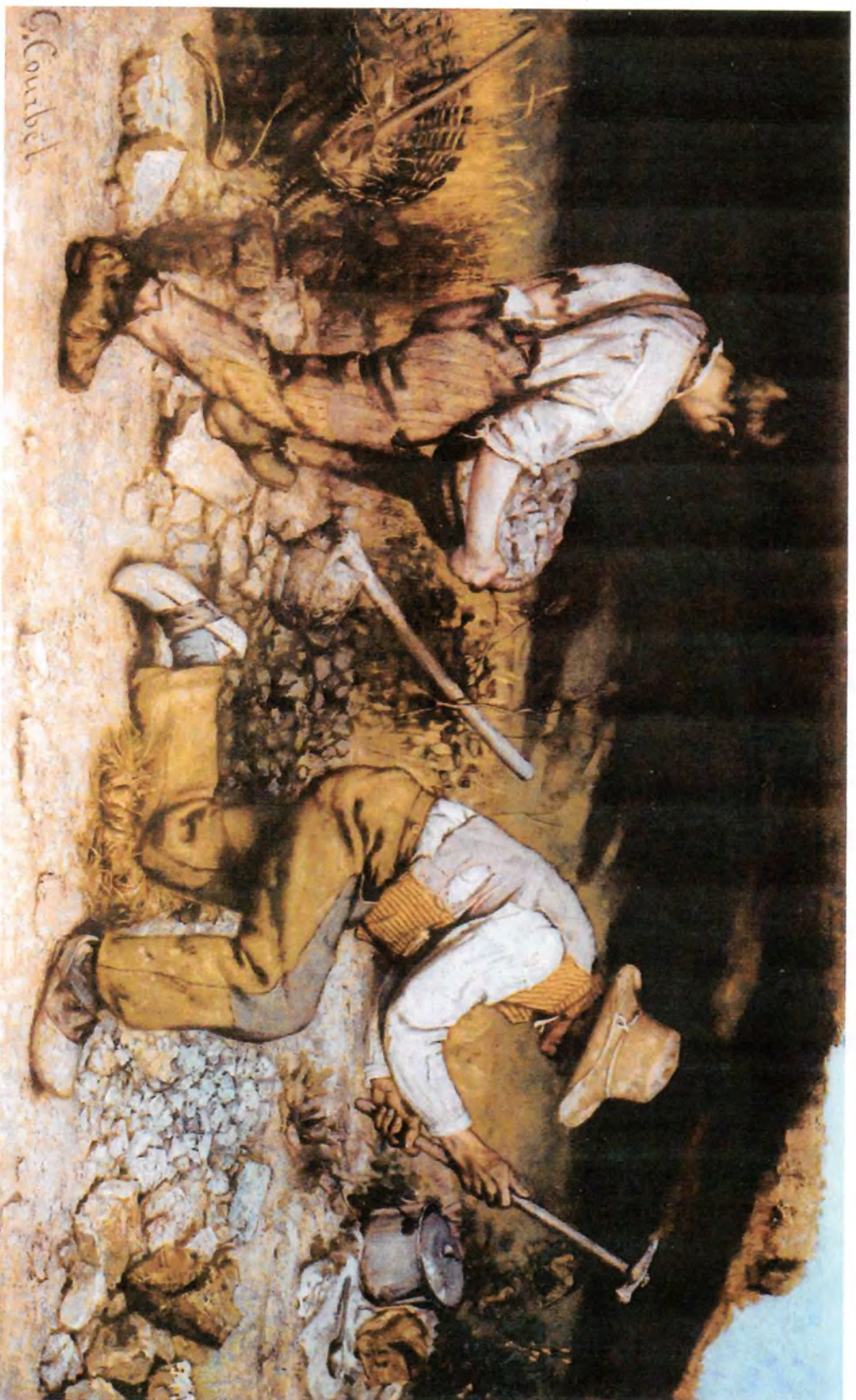
Gustave COURBET, Les casseurs de pierre , 1850-51, huile sur toile, 165 x 257 cm [œuvre détruite en 1945]. Gemäldegalerie, Dresde.