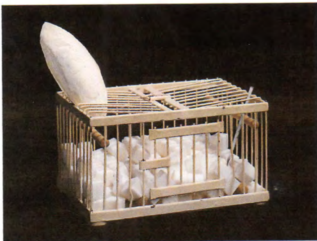
Vue n° 2