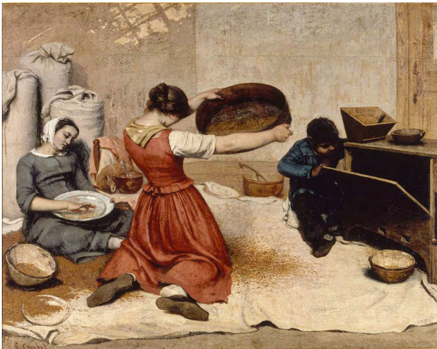
Gustave COURBET , Les Cribleuses de blé , 1854. Huile sur toile, 131 x 167 cm., Musée des Beaux- Arts de Nantes