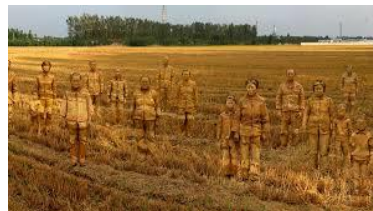
Liu Bolin, 2013 Hiding in the city - 126 cancer village