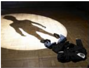
P Ramette, L'ombre de moi-même 2007