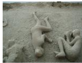
Pompei, gangué de cendres