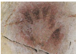
Empreinte pariétale préhistorique.