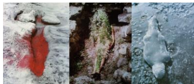
Ana Mendieta, Traces