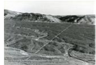
R Long, A line made by walking