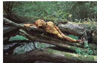
Nils-Udo, sans titre