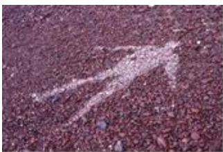
Goldworthy, Silhouette de pluie