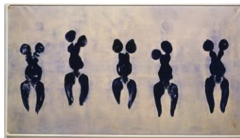
Yves Klein, Anthropométrie 1960