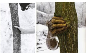
Penone performance et installation, Il poursuivra sa croissance sauf en ce point , 1968