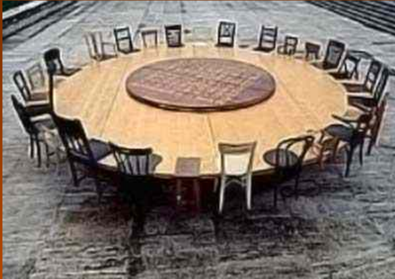
TABLE RONDE, 1995

550 cm de diamètre x 180 cm de hauteur Château d'Angers